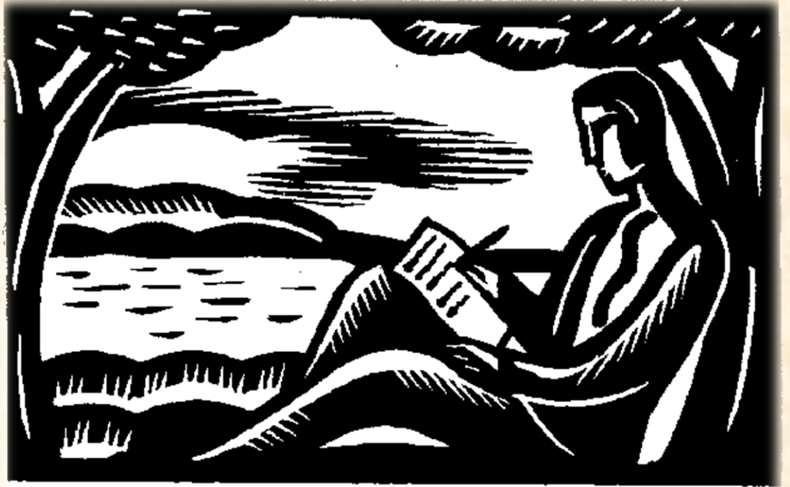
ILLUSTRATION BY ANTHONY RUSSO

❖ Sen olsaydın, nasıl bir «son» yazardın?